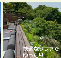
快適なソファでゆったり