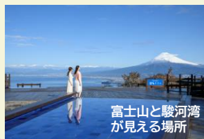
富士山と駿河湾が見える場所

伊豆パノラマパークではロープウェイに乗って葛城山山頂へ。晴れていれば富士山・駿河湾・街並みを一望できる大パノラマが! 足湯、神社、オシャレなカフェなど映える写真が撮れること間違いなし♪自由に座ってくつろげるソファもありわんちゃんと一緒にリラックスできる空間です。